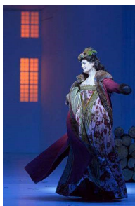
Anja Harteros