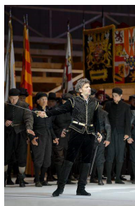
Jonas Kaufmann