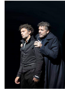
Jonas Kaufmann și Thomas Hampson

Merg mai departe. De 25 de ani, renumitul bariton american Thomas Hampson apare sezon de sezon pe scena festivalului salzburghez. Într-o multitudine de roluri de operă, recitaluri de lied, concerte vocal-simfonice. Versatilitatea vocii sale pare infinită și cel puțin în repertoriul liric cântă de la baroc la muzică contemporană, neocolind niciun stil, nicio epocă. A abordat în 2013 rolul Marchizului de Posa, personaj verdian al cărui spirit profund generos trebuie neîndoios să se regăsească în virtuțile timbrale ale interpretului, prin rotunjime, căldură, velur, înveșmântare în armonice, într-un cuvânt, prin așa-numita generozitate vocală. Aici s-au situat carențele artistului, întrucât Hampson a expus un glas cvasi-tenoral (pe alocuri, chiar mai puțin consistent decât al tenorului Kaufmann), un cânt liniar cu sunete „deschise” (de pildă, acuza dură adusă Regelui în duet, „La pace è dei sepolcri!”), deși forțată și intonată „mai sus”, nu a impresionat deloc, nu a cutremurat). La 58 de ani, meritele lui Thomas Hampson sunt însă incontestabile în menținerea unei frazări frumoase și cultivate, unei respirații ideale și unei ținute scenice nobile, fără excese, adecvate personajului.